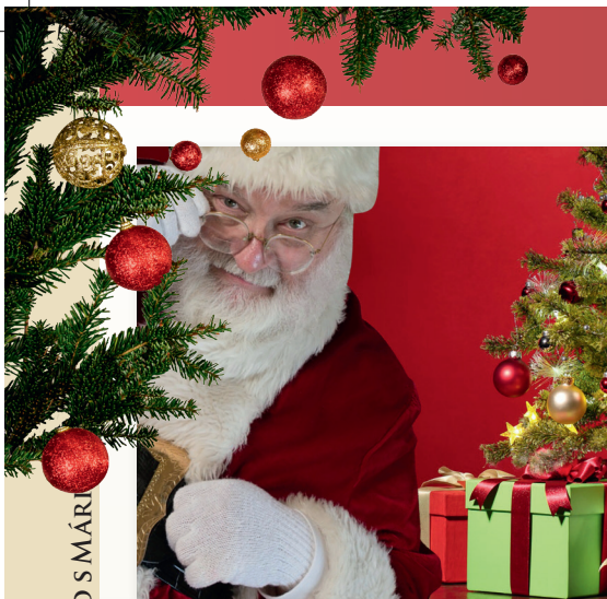
SPOJENECTVO S MÁRI