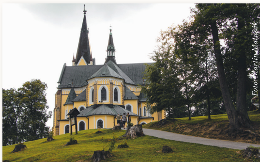
Foto: Mariánska hora

záciu púti: ohrozovali ich autami, obmedzovali tok pitnej vody, cesty zahradili stromami, aby sa na horu nedali dopraviť potraviny a voda. V roku 1983 KNV v Košiciach prikázal zbúrať vonkajší