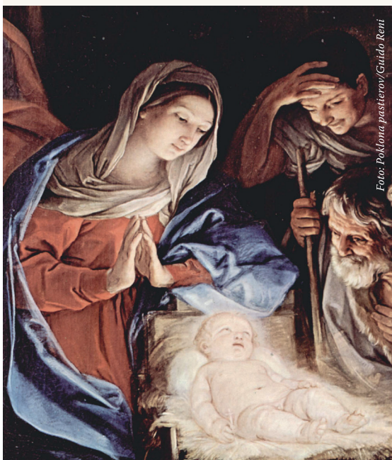
Foto: Poklona pastierov/Guido Reni

Vo svojej nekonečnej múdrosti chcel, aby boli pri Jeho narodení zastúpení