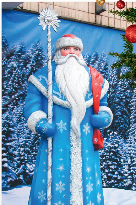
MIJENECTVO S MARIU

Dochádza, samozrejme, aj k neutrálnym zmenám, ako napríklad sane ťahané sobmi (v našej tradícii chodil skôr pešo), či oblečenie do červených šiat (predtým mitra a ornát boli obvykle zlaté alebo strieborné). Aj ony však svedčia o tom, že podmienky diktuje nenáboženská kultúra. Za gro-