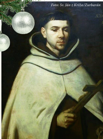
Foto: Sv. Ján z Kríža/Zurbarán

radosťou mystické potešenie, ktoré dostával od Boha. Hlásal, že na dosiahnutie úplnej jednoty s Najsvätejšou Trojicou je nevyhnutné úplné vnútorné zrieknutie sa všetkého. Básne, ktoré v tom čase vznikli, Duchovná pieseň a Temná noc , sú jedným z vrcholov mystiky.