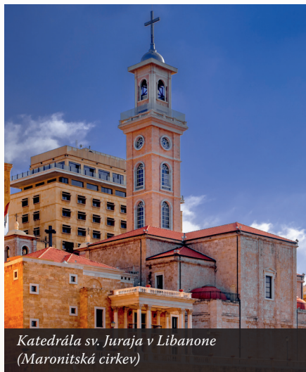
Katedrála sv. Juraja v Libanone (Maronitská cirkev)