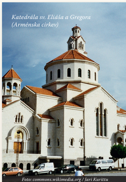
Katedrála sv. Eliáša a Gregora (Arménska cirkev)

svoj vplyv na územia obývané pohan-skými národmi. Prijatím viery v Krista tieto národy priniesli svoje zvyky, jedinečnú zbožnosť a materiálnu kultúru svojich národov do spoločenstva veriacich, čím obohatili drahocennú pokladnicu Cirkvi.