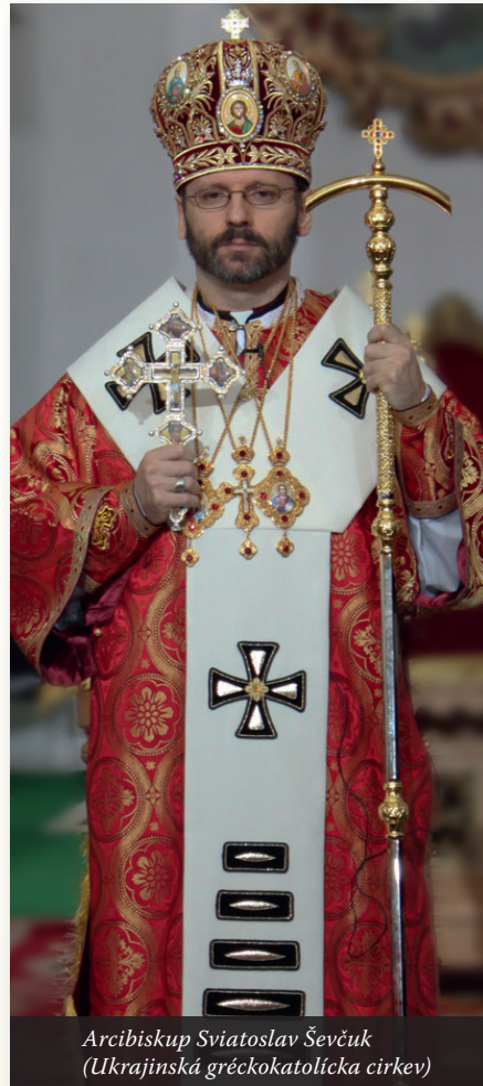
Arcibiskup Sviatoslav Ševčuk (Ukrajinská gréckokatolícka cirkev)

V roku 1990 pápež sv. Ján Pavol II. promulgoval Kódex kánonov východných cirkví . V ňom uviedol dvadsaťštyri spoločensvá, ktoré sú súčasťou univerzálnej Cirkvi, ale nepatria do okruhu latinskej civilizácie. Od rímskej Cirkvi sa odlišujú iným spôsobom