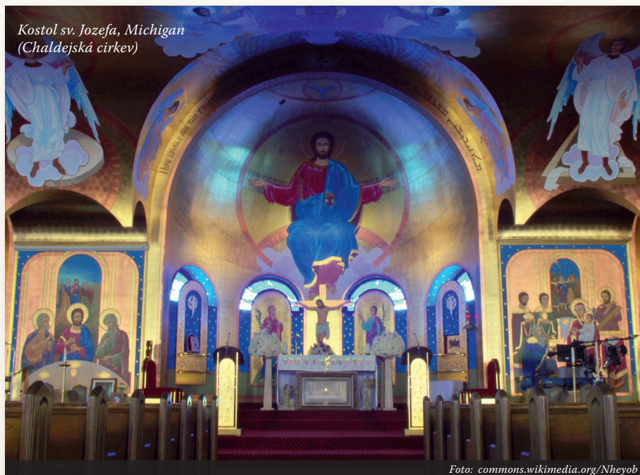
Kostol sv. Jozefa, Michigan (Chaldejská cirkev)

• Jednou z najdôležitejších cirkví v krajine kresťanského východu je Maronitská cirkev . Jej korene siahajú do štvrtého storočia a hoci nikdy neprerušila cirkevné spoločenstvo s Rímom, v roku 1182 na východnom pobreží Stredozemného mora po víťaznej prvej krížovej výprave maronitský patriarcha s celým svojím klérom a ľudom formálne vstúpil do únie s Rímom. Liturgiu slúži v antiochijskom obrade, ktorý je podobný gréckemu. Medzi jeho charakteristické črty patrí požehnanie paténou a kalichom a mi-