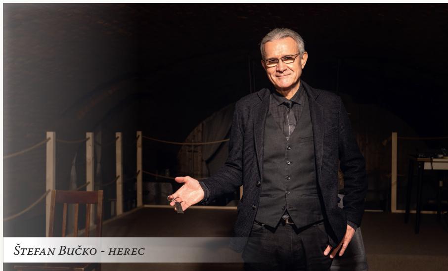
ŠTEFAN BUČKO - HEREC